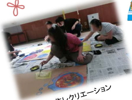
工作レクリエーション