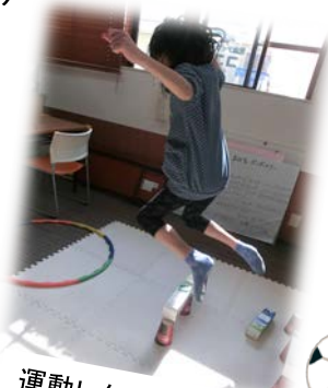
運動レクリエーション