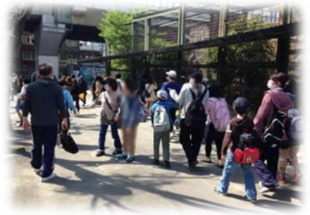
天王寺動物園にお出かけ