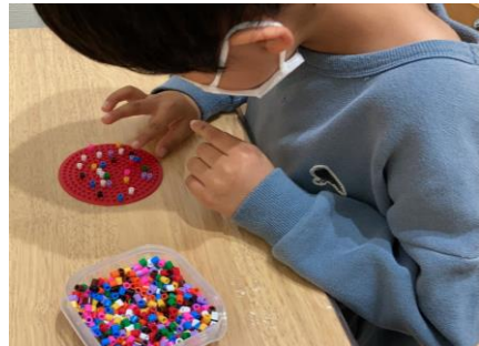
▲それぞれに合わせた個別課題