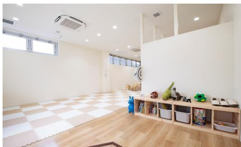
▲子どもたちが元気いっぱい過ごせる 明るくて清潔なフロア