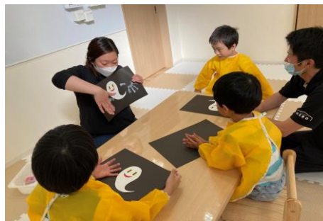
▲多彩なプログラムで豊かな経験を