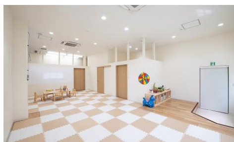
▲静かに学習できる個室も