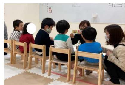
▲ソーシャルスキルトレーニング