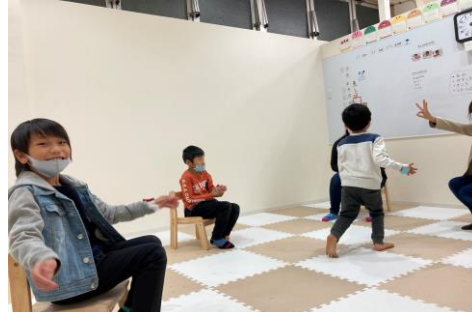
▲プレイフルな集団活動