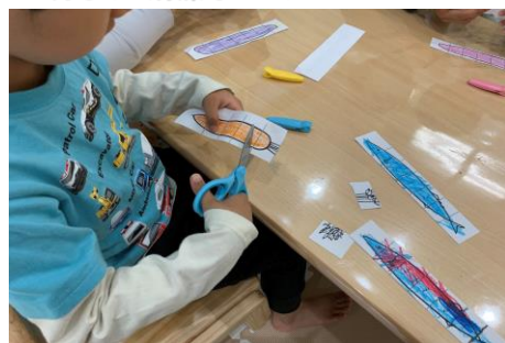
▲身辺自立 トイレ・食事など