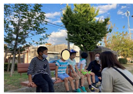
▲ルールを守って外あそび