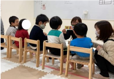
▲ソーシャルスキルトレーニング