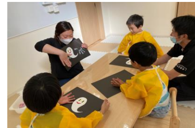
▲多彩なプログラムで豊かな経験を