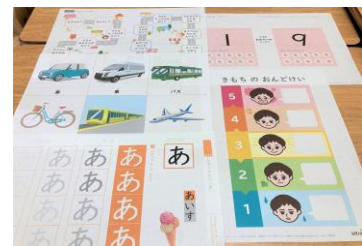
▲専門家監修のLITALICO教材