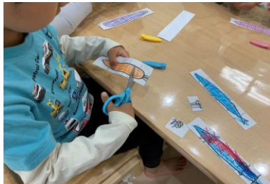
▲身辺自立 トイレ・食事など