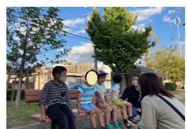
▲ルールを守って外あそび