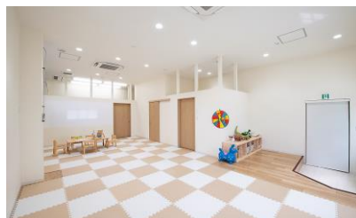
▲静かに学習できる個室も