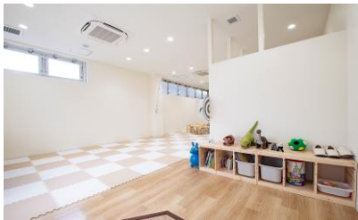
▲子どもたちが元気いっぱい過ごせる 明るくて清潔なフロア