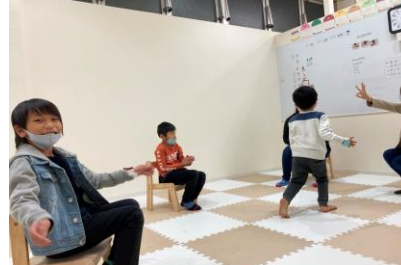
▲プレイフルな集団活動